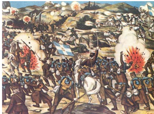
Εικόνα 3: Σκηνή της μάχης του Λαχανά σε λαϊκή εικόνα της εποχής.

Όπως αποδείχθηκε και εκ των υστέρων, οι Βούλγαροι είχαν οχυρώσει την κύρια άμυντική τους γραμμή μπροστά από το Κιλκίς με ένα πραγματικό δάσος όρυγμάτων, ενισχυμένων από πολυβολεία, που στο κεντρικό τμήμα έφταναν σε βάθος μέχρι και 6 χλμ. Έτσι, προκειμένου να επιτευχθεί ή κατάληψη της γραμμής αυτής με όσο το δυνατόν λιγότερες απώλειες, αποφασίστηκε να εκτελέσει η 2 η μεραρχία πλευρικό νυχτερινό αϊφνιδιασμό. Σύμφωνα με αυτό το σχέδιο, το 1 ο και 7 ο σύνταγμα της 2 ης μεραρχίας πέρασαν το Γαλλικό ποταμό και στις 3.30 πλησίαζαν τα έχθρικά χαρακώματα. Οι κινήσεις τους έγιναν αντιληπτές από τους Βουλγάρους, που νόμισαν ότι πρόκειται για γενική νυχτερινή επίθεση. Ακολούθησε ανταλλαγή πυρών του πυροβολικού για μία ώρα περίπου. Στο μεταξύ, στις 4.10 περίπου τα δύο συντάγματα κατέλαβαν την πρώτη έχθρική γραμμή, στις 5.00 τη δεύτερη και έπειτα από σκληρή, σώμα με σώμα, μάχη κατέλαβαν, κατά τις 10.00 το πρωί την τρίτη και πιο όχυρη θέση.