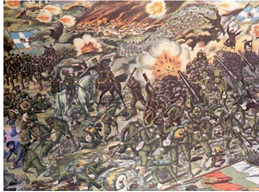
Εικόνα 2: Σκηνή της μάχης του Κιλκίς σε λαϊκή εικόνα της εποχής.

Σαρηγκιόλ, όπου όμως κατά τις 3.00 το απόγευμα καθηλώθηκε από τα έχθρικά πυρά, παρά την κάλυψη του έλληνικού πυροβολικού. Τέλος, έφτασε, καταδιώκοντας μεμονωμένα βουλγαρικά τμήματα στα ύψώματα Άρμουτζή, όπου και διανυκτέρευσε.