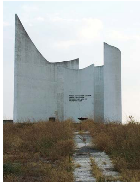
Εἰκόνα 4: Τὸ Ἡρώων τῆς μάχης τοῦ Κιλκίς.

Ἡ μάχη Κιλκίς-Λαχανᾶ, παρότι ὑπῆρξε ἡ πρώτη μόνις μίας σειρᾶς μαχῶν μεταξὺ τῶν μέχρι πρότινος συμμάχων τοῦ Ἀ΄ Βαλκανικοῦ πολέμου, λειτούργησε ὡς καταλύτης γιὰ τὴν ἐξέλιξιν τῶν μετέπειτα γεγονότων. Ἡ προσφορὰ τῆς ἐγκεῖται κυρίως στὸ ὅτι ἐπέφερε ἓνα καίριον πλήγμα στὸ βουλγαρικὸ στρατό, τόσο σὲ ἐπίπεδο μαχητικόν, ὅσο καὶ στὸν ψυχολογικὸ τομέα, καθὼς ἀπέδειξε πῶς ὁ ἐχθρὸς δὲν ἦταν ἀήττητος, γκρεμίζοντας ἔτσι τὸ προπαγανδιστικὸ κατασκεῦασμα τῶν Βουλγάρων, ποῦ ἀναφέρθηκε παραπάνω. Παράλληλα, ἡ μάχη αὐτὴ ἀνέδειξε τὴ γενναιότητα καὶ τὴν αὐτοθυσίαν τῶν Ἑλλήνων στρατιωτῶν, ποῦ κατελιμμένοι ἀπὸ μίαν «ἱερὴν τρέλα» ἔπεφταν κυριολεκτικὰ πάνω στὰ ἐχθρικὰ πολυβόλα χωρὶς κανέναν ἐνδοιασμό, σπέρνοντας τὸν πανικὸν στοὺς Βούλγαρους στρατιῶτες, μετὰ ἀποτέλεσμα νὰ ἐγκαταλείπουν τὶς θέσεις μάχης καὶ νὰ φεύγουν κυνηγημένοι καὶ ἀναγκάζοντας τὸν Βούλγαρο ταγματάρχη Ἡλίου νὰ ὁμολογήσῃ ὅτι: «Ὁ στρατὸς μας δὲν ἀντέχει πρὸ τῶν φοβερῶν ἐφοδῶν σας. Εἰς τὸ Κιλκίς τὴν ὁρμὴν σας τὴν ἐξηγήσαμεν κατ' ἀρχὰς ὡς δεῖγμα τῆς ἐσχάτης ἀπελπισίας σας. Μόνον μανιακοί, μεθυσμένοι ἢ ἀπηλπισμένοι θὰ ἔκαμναν τοιαύτας φρενήρεις ἐπιθέσεις, ἀκάλυπτοι, δεκατιζόμενοι, ἐναντίον τῶν πυροβολείων. Ἄλλ' ἐπέισθημεν κατόπιν ὅτι οἱ θυελλώδεις ἐφοδοὶ σας, μετὰ τὰς ὁποίας ἐπετύχατε τὴν μείωσιν τοῦ ἡθικοῦ τῶν ἀνδρῶν μας, δὲν ἦσαν ἀποτέλεσμα παραλογισμοῦ ἢ ἀπελπισίας, ἀλλ' ἀνάγονται εἰς σύστημα ἰδιαίτερον, εἰς τὴν ἄγραφον ἐκείνην τακτικὴν τοῦ στρατοῦ σας, τὴν σύμφωνον πρὸς τὴν ἐθνικὴν ἰδιοσυγκρασίαν σας».