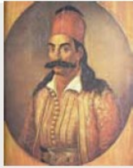
Γ.Καραϊσκάκης μάχη στο Φάληρο 1827