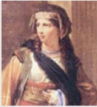
Α.Λιδωρίκη πολιορκία της Ακρόπολης 1826