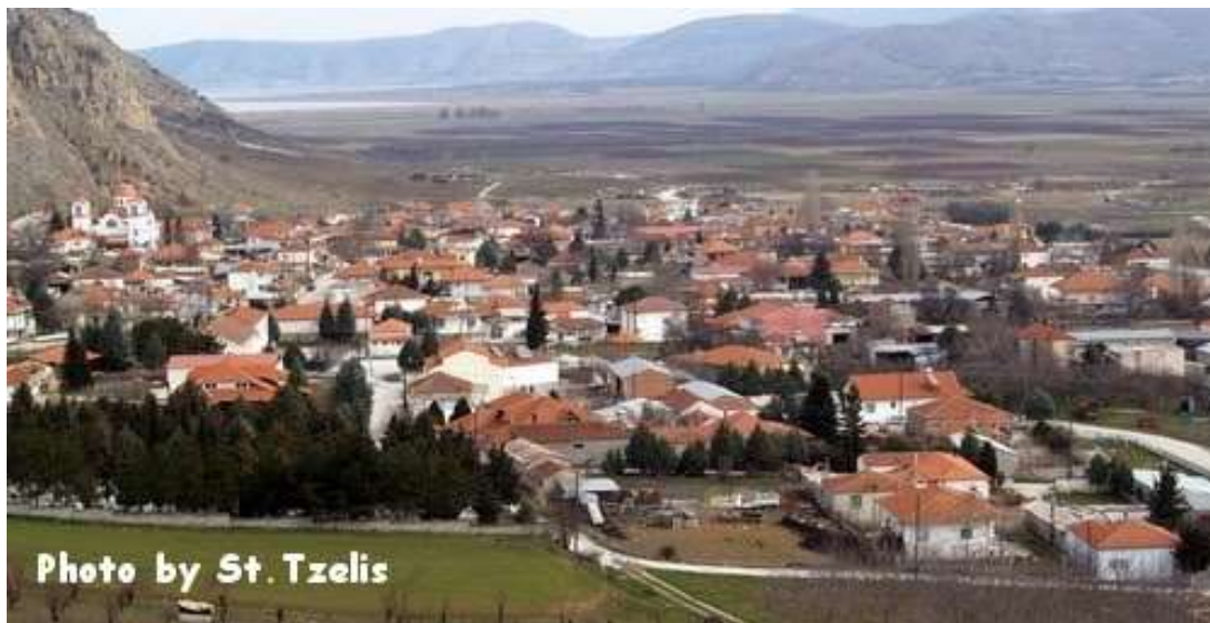
Η Βεγόρα σήμερα

Έτσι 911 άτομα κάτοικοι του χωριού εκτοπίστηκαν από το Τσιφλίκ στην Παϊπούρτη και από εκεί, μέσω Ντιαμπακίρ, Χαλεπίου και Βηρυτού έφθασαν στην Ελλάδα μόλις τα 250 άτομα, με απώλειες του 75 % των κατοίκων και εγκαταστάθηκαν, στο χωριό Κλείτος Κοζάνης και στο χωριό μας, στη Βεγόρα Φλωρίνης με την μακρόχρονη ιστορία του, χιλιετιών, ταυτόσημο πλέον με την Χάλκινη Ασπίδα των Μακεδόνων Μαχητών, που βρέθηκε στο χωριό μου και προέρχεται πιθανότατα από τη μάχη του 274 π.Χ., που έγινε στην περιοχή μεταξύ του βασιλέως των Μολοσσών Πύρρου και του Μακεδονικού στρατού του Βασιλέως Αντιγόνου.