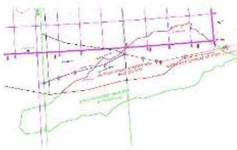
Σχήμα 6 Περιοχή λεκάνης Ηροδότου