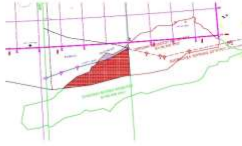
Σχήμα 7 Κατανομή λεκάνης Ηροδότου

Με βάση τις πιο πάνω διαπιστώσεις, και το λιτό κείμενο της συμφωνίας που ήδη δημοσιεύτηκε, μπορούμε να κάνουμε μια πρώτη εκτίμηση για τα πιθανά οφέλη και ζημιές που η Ελλάδα αποκομίζει από αυτήν την συμφωνία.