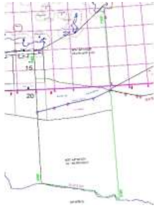
Σχήμα 1: Όρια οριοθέτησης