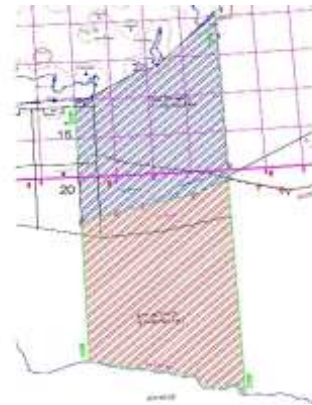
Σχήμα 2: Κατανομή ΑΟΖ

Πολλοί αναλυτές υποστηρίζουν ότι η μερική οριοθέτηση δεν προβλέπεται από την συμφωνία του Montego Bay του 1982. Παρόλα αυτά και η συμφωνία που έγινε πρόσφατα με την Ιταλία, αλλά και οι συμφωνίες που υπέγραψε η Κύπρος στο παρελθόν με την Αίγυπτο, το Ισραήλ και τον Λίβανο, ακολούθησαν την ίδια μεθοδολογία. Δηλαδή η οριοθέτηση έγινε χωρίς να ανακηρυχθεί πρώτα η ΑΟΖ, που αποτελεί θεωρητικά προϋπόθεση για την οριοθέτησή της, χωρίς βέβαια να αποκλείεται η μεταγενέστερη ανακήρυξη, με το δεδομένο πιθανόν ότι η επίτευξη μιας συμφωνίας έχει μεγαλύτερη αξία κάτω από ιδιαίτερες συνθήκες (αντίστοιχη περίπτωση οριοθέτησης ΑΟΖ Κύπρου-Αιγύπτου το 2003).