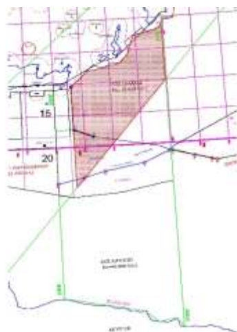
Σχήμα 3: Προσβολή Τουρκολιβικού Συμφώνου