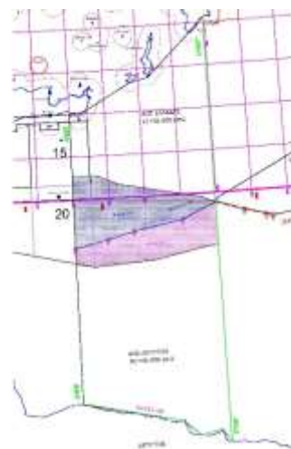
Σχήμα 4: Κατανομή περιοχής μεταξύ προταθειών από Τουρκία και Ελλάδα οριοθετήσεων