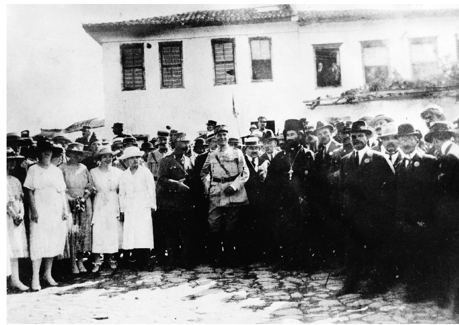
Ο γάλλος στρατηγός Σαρπί (κέντρο) και αριστερά του ο στρατηγός Ε.Χ. Ζυμβρακάκης.

διάταγμα της επιστρατεύσεως μέχρι του 50ού έτους και προσωρινώς καλεί υπό τα όπλα μόνον τας κλάσεις 1900 και 1901, οι οποίοι θα καταταγούν εις το Σώμα της Χωροφυλακής και θα χρησιμοποιηθούν εις μάχιμον υπηρεσίαν.