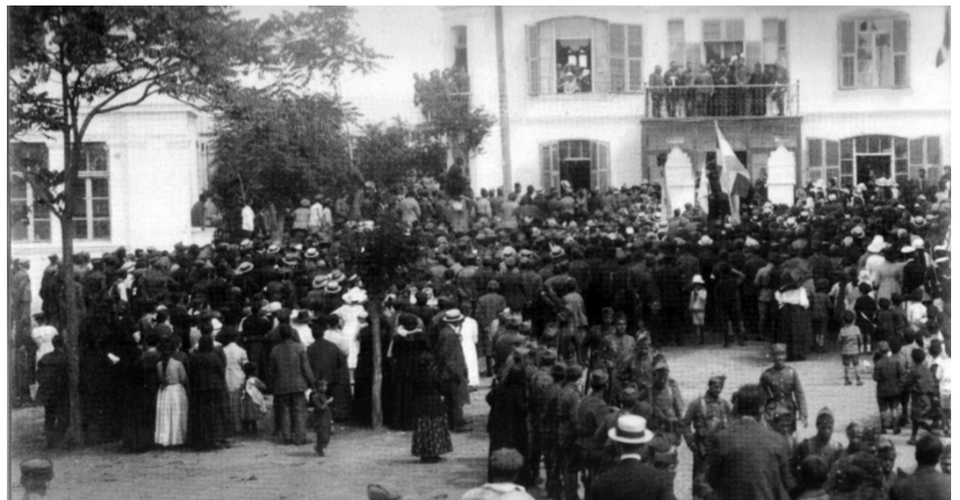
Ο στρατηγός Κωνσταντίνος Μαζαράκης-Αινιάν στις 15 Μαΐου 1920 χαιρετά από τον εξώστη του μπτροπολιτικού μεγάρου του Δεδέαγατς (Αλεξανδρούπολη) τους κατοίκους της πόλης.

Γκιμουλτζίνα, 14 (ιδ. τηλ.). Αληθώς μεγαλειώδης η είσοδος του εθνικού στρατού εις την πόλιν μας και αληθώς συγκινητική η γενομένη προς αυτόν υποδοχή. Η πόλις, ξυπνήτη με το γλυκοκράγαμα, έφερε τα γιορτερά της. Αι κυανόλευκοι, πυκνοαναρτημένοι, συνεπλέκοντο από το πρωινό γλυκό αγέρι, όλη δ' η πόλις εις τον μακρόθεν θεώμενον αυτήν εφαινετο κεκαλυμμένη από τα εθνικά χρώματα. Λίαν πρωί οι κώδωνες ήχουν χαρμοσύνως, κύματα δε κόσμου εξεχύνοντο προς την είσοδον της πόλεως, όπως υποδεχθούν τον ελευθερωτήν στρατόν. Από της 6.30' π.μ. όλοι αι κοινοτικά αρχαι, Ελληνικά, Τουρκικά, Εβραϊκά, Αρ-