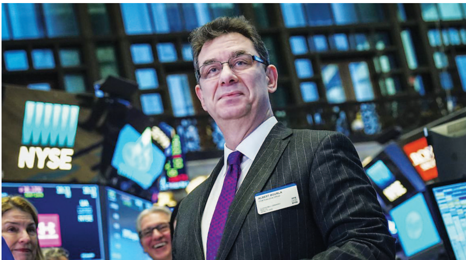
Ο ισχυρός άντρας της αμερικανικής φαρμακευτικής Pfizer, Αλβέρτος Μπουρλά, γεννήθηκε και μεγάλωσε στη Θεσσαλονίκη και έτσι η πόλη είχε προβάδισμα στις διεθνείς επενδύσεις της εταιρείας.

Στον τομέα της ενέργειας, έγινε αναφορά στις πρώτες εισαγωγές αμερικανικού υδρογονοποιημένου φυσικού αερίου στην Ελλάδα, στον σχεδιαζόμενο σταθμό της Αλεξανδρούπολης, στην πρόοδο του Διαδριατικού Αγωγού Φυσικού Αερίου (TAP) και του Διασυνδεδετήριου Αγωγού Ελλάδας - Βουλγαρίας (IGB) και στην πρόθεση της Ελλάδας να διερευνήσει ευκαιρίες για την περαιτέρω επέκταση των ενε-