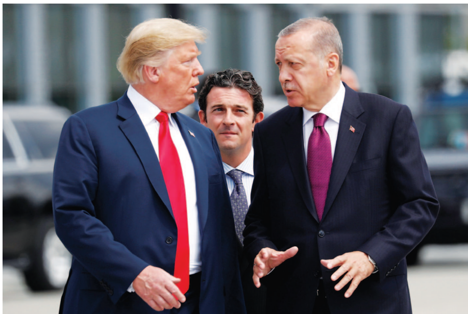
Η απόκτηση των ρωσικών συστημάτων S-400 από την Τουρκία, το 2020, υπήρξε κομβικό σημείο για την αλλαγή των γεωστρατηγικών δεδομένων και η αμερικανική διοίκηση, υπό τον Ντόναλντ Τραμπ, προχώρησε σε αντίποινα, αναστέλλοντας την προμήθεια των F-35 και επιβάλλοντας κυρώσεις μέσω του Countering America's Adversaries Through Sanctions (Νόμος για την Αντιμετώπιση των Αντιπάλων της Αμερικής Μέσω Κυρώσεων).

Μετά τον ψυχρό πόλεμο η Τουρκία θεωρείται ως «κράτος-κλειδί» για την Ευρασία μαζί με την Ουκρανία, το Αζερμπαϊτζάν και το Ιράν 64 , ενώ οι ΗΠΑ, η Γαλλία, η Γερμανία, η Ρωσία και η Κίνα είναι οι κύριοι γεωστρατηγικοί δρώντες της. Η Τουρκία, χώρα ζωτικής σημασίας για την εξυπηρέτηση των αμερικανικών συμφερόντων, λόγω της γεωπολιτικής της θέσης, και της συμμετοχής της στο NATO - όντας δεύτερη σε μέ-