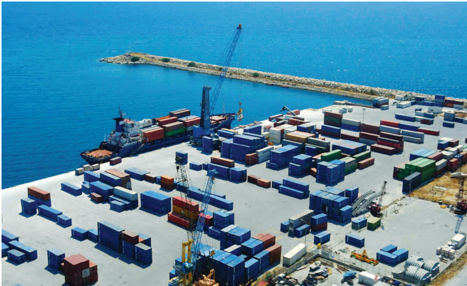
Για το λιμάνι «Φίλιππος Β΄» στην Καβάλα, το οποίο είναι προς ιδιωτικοποίηση μέσω ΤΑΙ-ΠΕΔ, έχουν εκδηλώσει επενδυτικό ενδιαφέρον η Black Summit Financial Group και η τεξανή Quintana Infrastructure and Development.

γκτον να πιέζει την Ελλάδα για τη μη περαιτέρω επέκταση των οικονομικών σχέσεων με την ασιατική δύναμη 56 . Από την άλλη για το Πεκίνο η Ελλάδα αποτελεί ένα μέσο προκειμένου να αποκτήσει ακόμη μεγαλύτερη παρουσία στην Ευρώπη.