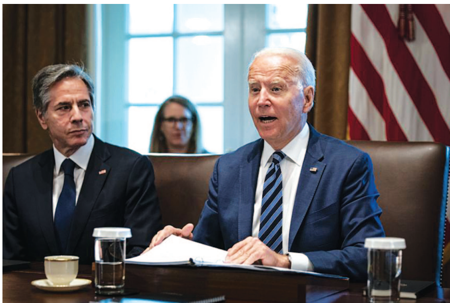
Οι ΗΠΑ, υπό τη διοίκηση του Τζο Μπάιντεν και με υπουργό Εξωτερικών τον Αντ. Μπλίνκεν (αριστερά), θα επιδιώξουν να επαναφέρουν την Τουρκία στη Δύση, εκμεταλλευόμενες κυρίως τις δυνάμεις στο εσωτερικό της που επιθυμούν πολιτική αλλαγή στον διεθνή προσανατολισμό της χώρας, καθώς και τη ρωσοαμερικανική αντιπαράθεση που εκτυλίσσεται κοντά στα τουρκικά σύνορα.

Η Ελλάδα οφείλει να κεφαλαιοποιήσει στον μέγιστο βαθμό τη σύζευξη συμφερόντων με την Ουάσιγκτον. Αυτή ρυθμίζεται από το είδος της σχέσης που αναπτύσσεται μεταξύ των δύο δρώντων αναφορικά με τη θέση τους στη διεθνή πολιτική. Στην παρούσα φάση είναι σχέση μιας μικρής - μεσαίας μεγέθους χώρας με μια μεγάλη