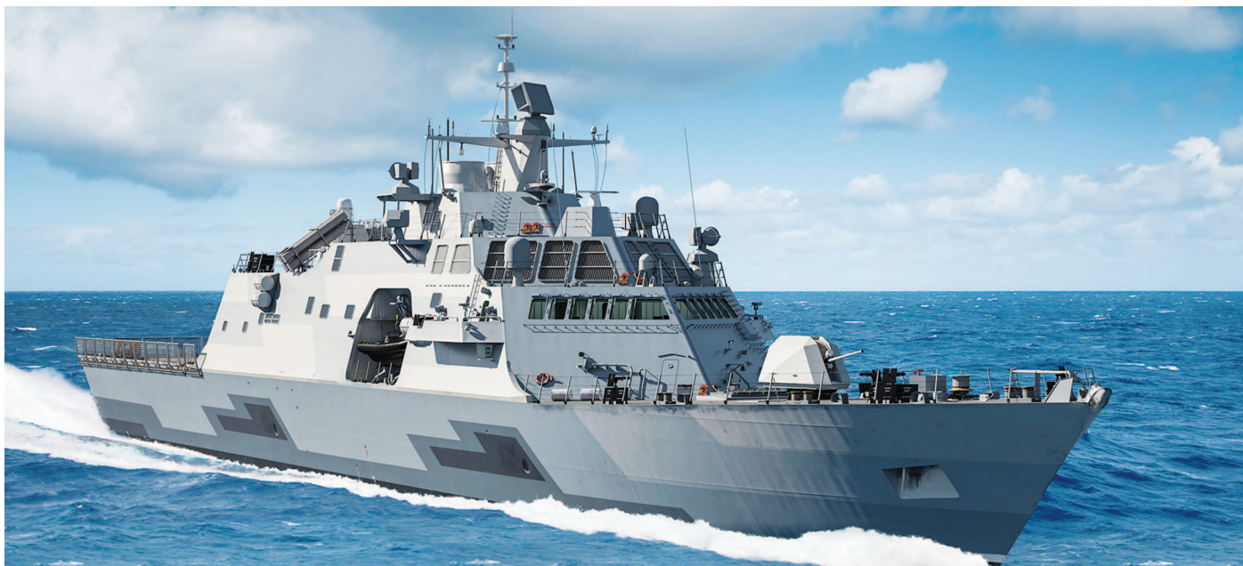
Με την πρόταση για την -σε επίπεδο σχεδιασμού ακόμα- φρεγάτα HF2 (ελληνική έκδοση της MMSC), στόχος της αμερικανικής πλευράς είναι η ενίσχυση της παρουσίας της στο ελληνικό Πολεμικό Ναυτικό, το οποίο μέχρι στιγμής διαθέτει εγχώριας κατασκευής και ευρωπαϊκής σχεδίασης πλοία με κύριους προμηθευτές τη Γερμανία, τη Γαλλία και την Ολλανδία.

γασίες. Οι επενδύσεις των εταιρειών που δραστηριοποιούνται, αποτυπώνουν το εύρος της ανάπτυξης σε αυτόν τον τομέα.