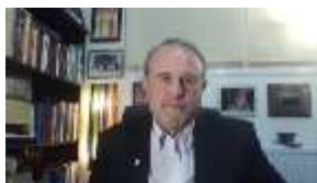
Του Ιωάννη Αθ. Μπαλτζώη*

Το διπλό «Όχι» στην ένταξη των δύο σκανδιναβικών χωρών, της Σουηδίας και Φινλανδίας, από την εριστική Τουρκία, η οποία για λόγους συμφερόντων της προκαλεί ακόμη και τους απομείναντες υποστηρικτές της και θέτει σε κίνδυνο όλη την ΝΑΤΟική, αμερικανική και ευρωπαϊκή προσπάθεια, για την τιθάσευση της ρωσικής ομοσπονδίας. Το «αγαπημένο παιδί» του Γ.Γ. του ΝΑΤΟ, έχει κάνει άνω κάτω την Συμμαχία και τις ΗΠΑ, για άλλη μια φορά, αλλά ο κ. Γ.Γ. την δικαιολογεί για μια ακόμη φορά, προκαλώντας τον εκνευρισμό των υπολοίπων κρατών του ΝΑΤΟ. Το γιατί το κάνει, εκτός από αυτά που ισχυρίζεται η Τουρκία, ή υπονοούνται υπάρχει και μια άλλη θεωρία. Ο Ρώσος πολιτικός αναλυτής Κονσταντίν Σοκόλοφ αλλά και ο γενικός γραμματέας του Τουρκικού Κόμματος Μητέρας Πατρίδας, Dogu Perincek, αποκάλυψαν πως πίσω από την κρίση ΝΑΤΟ-Τουρκίας βρίσκεται μάλλον το αμερικανικό σχέδιο δημιουργίας Κουρδικού κράτους.