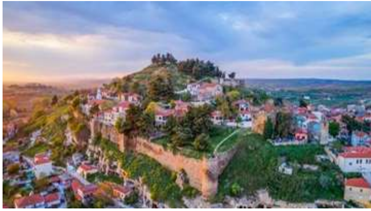
Το Κάστρο του Διδυμοτείχου