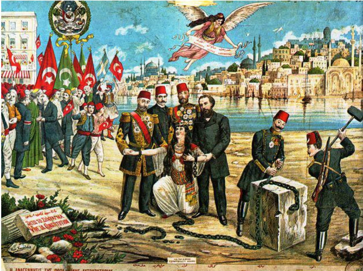
Αναπαράσταση της απελευθέρωσης της Οθ Αυτοκρατορίας από τους Νεότουρκους

Αναπαράσταση της απελευθέρωσης της Οθ Αυτοκρατορίας από τους Νεότουρκους