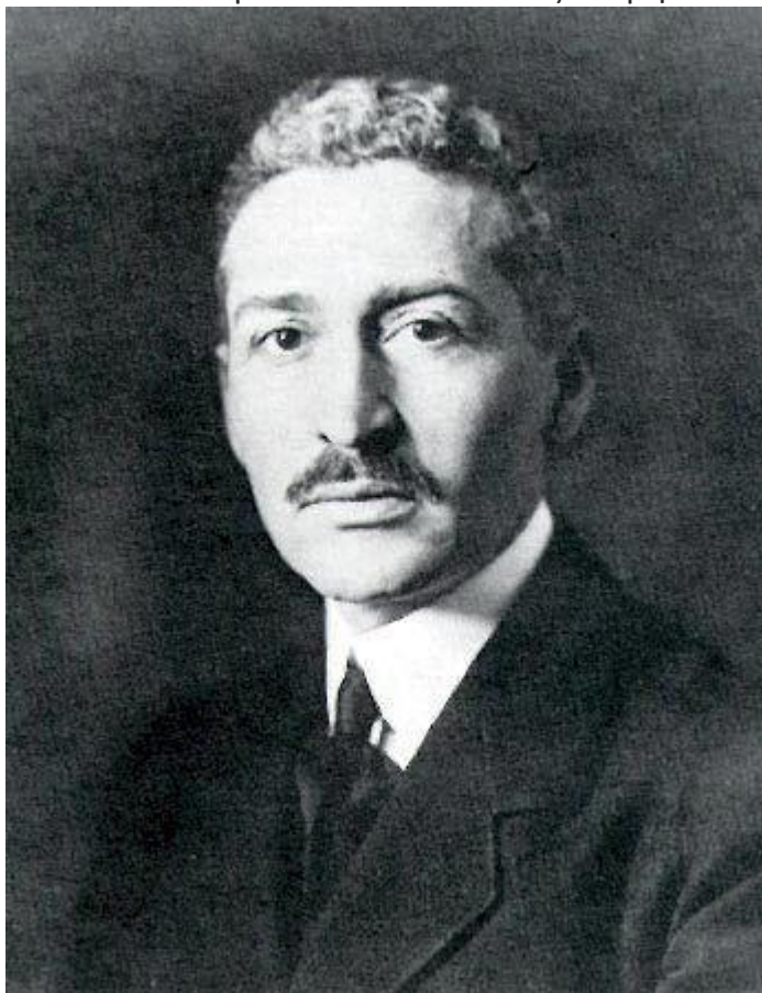
Ίων Δραγούμης

Ο Ίων Δραγούμης ήταν Έλληνας διπλωμάτης που υπηρετούσε ως πρόξενος στη Κωνσταντινούπολη μετά από δική του αίτηση, έχοντας πρωταγωνιστήσει στον Μακεδονικό Αγώνα επιδεικνύοντας τόλμη και υψηλή φιλοπατρία.