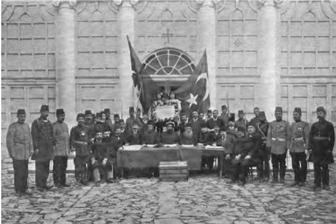
1908 Διακήρυξη του Συντάγματος από τους Νεότουρκους

συγκοινωνούν δοχείο με το Ελληνικό υπουργείο εξωτερικών και οι διαφοροποιήσεις της από την επίσημη Ελληνική πολιτική ήταν ανεπαίσθητες. Έτσι αποφασίστηκε η ειλικρινής συμμετοχή της οργάνωσης στις πρώτες οθωμανικές εκλογές του 1908.