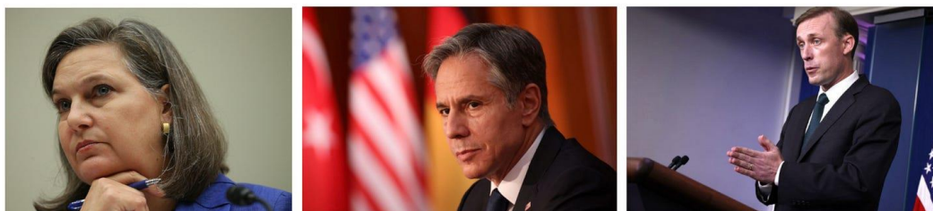
ΟΙ ΠΑΙΚΤΕΣ Από αριστερά προς τα δεξιά: Victoria Nuland, Anthony Blinken και Jake Sullivan.

Αυτό που έγινε σαφές στους συμμετέχοντες, σύμφωνα με την πηγή με άμεση γνώση της διαδικασίας, είναι ότι ο Sullivan σκόπευε η ομάδα να καταστρώσει ένα σχέδιο για την καταστροφή των δύο αγωγών Nord Stream - και ότι εκπλήρωνε τις επιθυμίες των Πρόεδρος.