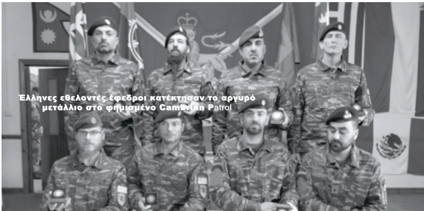
Έλληνες εθελοντές έφεδροι κατέκτησαν το αργυρό μετάλλιο στο φημισμένο Cambodian Patrol

ΕΠΟΠ και γενικώς όσων επέλεξαν τον στρατό γιατί ήταν ο μόνος τρόπος να διορισθούν στο δημόσιο και είχαν πρόσβαση σε βουλευτή για να το πετύχουν! Η, προ ετών, σύλληψη των δύο οπλιτών μας στον Έβρο είναι ένα χαρακτηριστικό παράδειγμα αποτυχίας του υφισταμένου συστήματος.