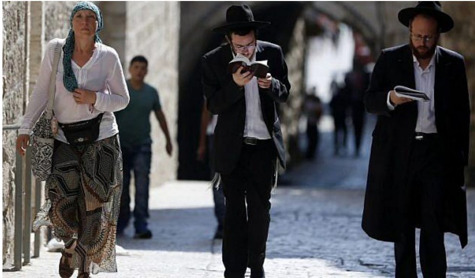
Υπερορθόδοξοι Εβραίοι Haredi.

Οι παρευρισκόμενοι έριξαν μεγάλο μέρος της ευθύνης στους «Zilbermans», μέλη μιας λιθουανικής υπερορθόδοξης κοινότητας 300 οικογενειών στην Παλιά Πόλη, που διακρίνεται από τις άλλες κοινότητες Haredi με τη μοναδική τους προσέγγιση στη μελέτη της Τορά που περιλαμβάνει ακραίες Σιωνιστές αντιλήψεις. Αλλά και πολλοί Ισραηλινοί αξιωματούχοι πιστεύουν, ότι οι Χριστιανικές Εκκλησίες συχνά το παρακάνουν, καταθέτοντας ένα είδος ρητορικού φόρου στην Παλαιστινιακή Αρχή σε βάρος του Ισραήλ, για να εξασφαλίσουν την στήριξη και ευημερία των Παλαιστινίων, που αποτελούν το ποίμνιό τους. Θεωρούν ακόμη, αν και οι επικεφαλής πολλών εκκλησιών είναι συχνά Ευρωπαίοι, οι εκκλησίες και οι ιερείς είναι κυρίως Παλαιστίνιοι και οι τοπικές εκκλησίες είναι γεμάτες με παλαιστινιακή θεολογία απελευθέρωσης. Σε αυτό το σχολείο, οι Σιωνιστές Εβραίοι παίζουν το ρόλο των καταπιεστικών Ρωμαίων και οι Παλαιστίνιοι ταυτίζονται με τον Ιησού.