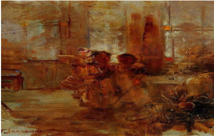
Γιώργος Ιακωβίδης, «Ρόδια»

Ομάδα σύνταξης: Μαργαρίτα Αντωνίου, Αλέξανδρος Κατράνης, Στέφανος Λαζαρίδης, Βασιλική Σκαρά, Bill Stamos, Γεωργία Χρονοπούλου 1