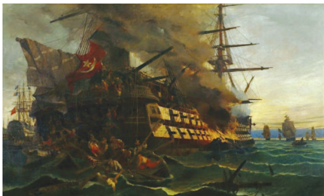
Η πυρπόληση της τουρκικής ναυαρχίδας από τον Δημήτριο Παπανικολή, στις 27 Μαΐου 1821 στον όρμο Ερεσού της Λέσβου. Πίνακας Κωνσταντίνου Βολανάκη.

Η Ελληνική Πολεμική Αεροπορία χαρακτηρίστηκε εξ αρχής από πρωτοποριακές κινήσεις, καθώς η χώρα αντελήφθη από πολύ νωρίς την αξία του αεροσκάφους (Α/Φ). Έτσι, από το 1911 τέθηκαν τα θεμέλια της ΠΑ, ελάχιστα μετά τα πρώτα βήματα του Κλάδου Στρατιωτικής Αεροναυπηγικής (Aéronautique Militaire) του Γαλλικού Στρατού, η οποία θεωρείται από πολλούς ως η πρώτη αεροπορική δύναμη παγκοσμίως (με Α/Φ βαρύτερα του αέρος). Το 1912 συγκροτήθηκε ο “Λόχος Αεροπορίας” στη Λάρισα, ο οποίος πραγματοποίησε την πρώτη πολεμική αεροπορική αποστολή αναγνώρισης (εναντίον των Τούρκων, στο μέτωπο της Θεσσαλίας), ενώ ακολούθησαν αποστολές βομβαρδισμού (με ρίψεις αυτοσχέδιων βομβών στα οχυρά του Μπιζανίου). Το 1913 πραγματοποιήθηκε η πρώτη πολεμική αποστολή ναυτικής συνεργασίας στον κόσμο πάνω από τα Δαρδανέλια, ανοίγοντας το δρόμο για την αξιοποίηση του αεροπορικού όπλου σε αεροναυτικές επιχειρήσεις [5].