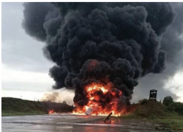
Καταστροφή ρωσικού στρατηγικού βομβαρδιστικού Tu-22M3, πιθανότατα από ουκρανικό επιθετικό μηΕΑ [17].

τα οποία μεταφέρουν εκρηκτικά φορτία σε μεγάλες αποστάσεις και χτυπούν τα εχθρικά πλοία στην ίσαλο γραμμή, προκαλώντας σοβαρές ζημιές [19].