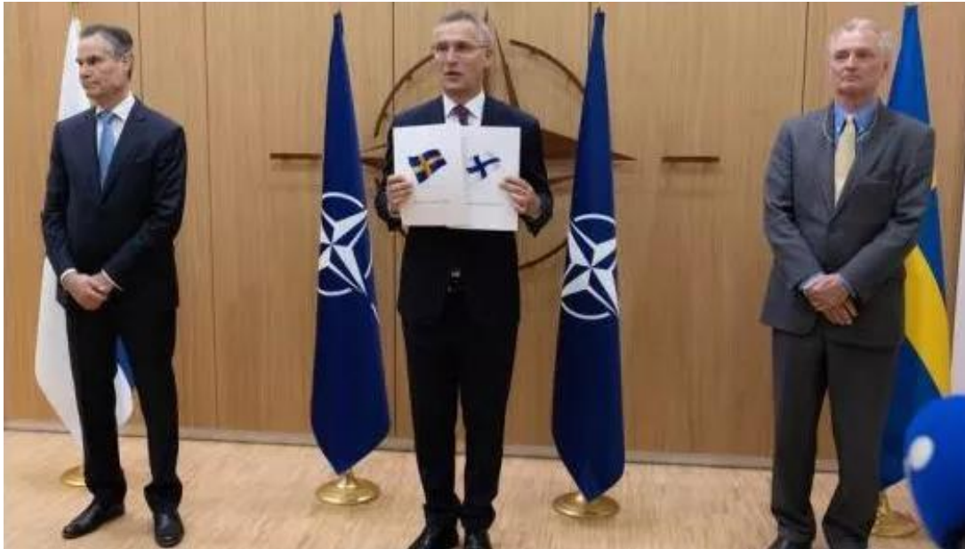
Στιγμιότυπο από την υποβολή του αιτήματος ένταξης της Σουηδίας και Φινλανδίας στο NATO

Όσον αφορά το αίτημα ένταξης της Σουηδίας στο NATO, αξίζει να σημειωθεί ότι είχε υποβληθεί στη Βορειοατλαντική Συμμαχία στις 18 Μαΐου 2022 ταυτόχρονα (Εικόνα 1) με τη Φινλανδία, ωστόσο η Τουρκία αντιτάχτηκε στην εν λόγω ενέργεια προβάλλοντας ως αιτία το εμπάργκο όπλων που είχαν επιβάλει τα δύο κράτη εναντίον της το 2019, καθώς επίσης και το γεγονός ότι τα δύο κράτη υπέθαλπαν μέλη του Εργατικού Κόμματος του Κουρδιστάν (Partiya Karkerên Kurdistan - PKK).