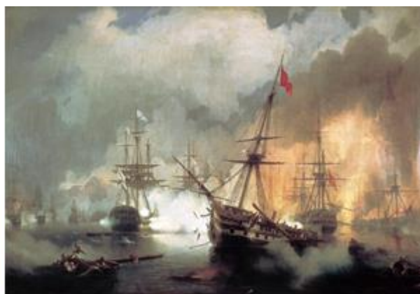
Η ναυμαχία του Ναβαρίνο, πίνακας του Ιβάν Αϊβαζόβσκι