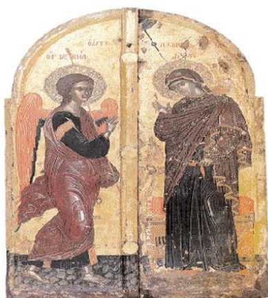
Ευσαγγελισμός της Θεοτόκου (Μονή Ξενοφώντος, Άγιο Όρος

Ομάδα σύνταξης: Μαργαρίτα Αντωνίου, Αλέξανδρος Κατράνης, Στέφανος Λαζαρίδης, Βασιλική Σκαρά, Bill Stamos, Γεωργία Χρονοπούλου 1