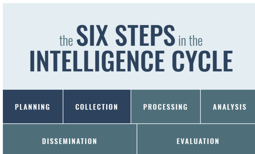
Εικόνα 1: Τα έξι στάδια του Κύκλου Πληροφοριών σύμφωνα με το ODNI.

Ανάλογα με την προέλευση ή/και τα μέσα συλλογής [iii] , οι πληροφορίες ταξινομούνται στις ακόλουθες έξι βασικές κατηγορίες: