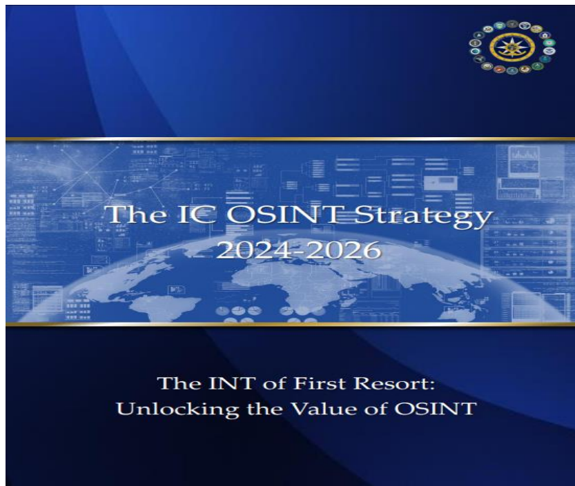
Εικόνα 5: Το εξώφυλλο της Στρατηγικής Πληροφοριών Ανοικτών Πηγών για το 2024-2026.

Πηγή: https://www.dni.gov/files/ODNI/documents/IC_OSINT_Strategy.pdf