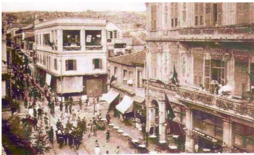
Vue de la „Place de la Liberté“ Proclamation de la Constitution Ottomane, 11/24 Juillet 1908

Η έναρξη από τη Θεσσαλονίκη του κινήματος των Νεότουρκων