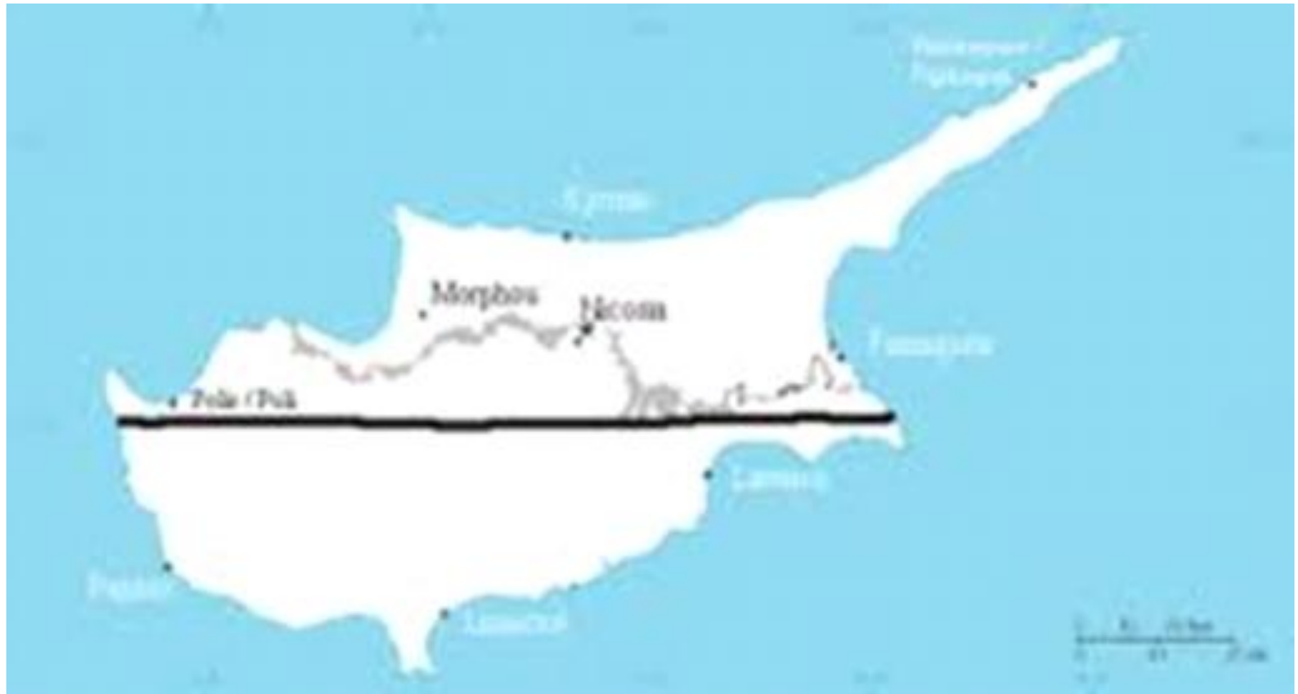
Εικόνα 5 : Τουρκικό Σχέδιο Διχοτόμησης (1957)