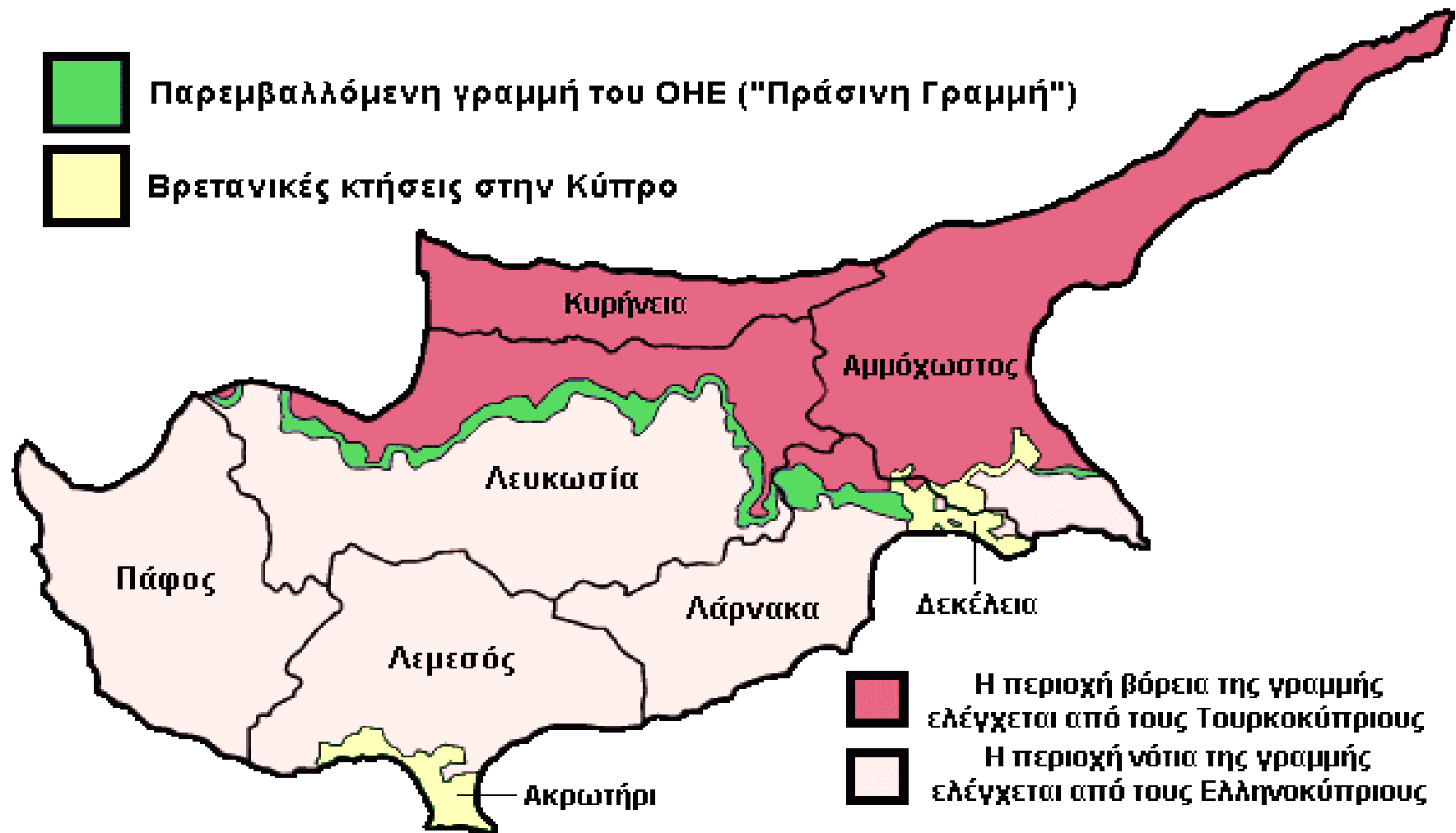
Εικόνα 2 : Χάρτης Τουρκικής Εισβολής (1974)