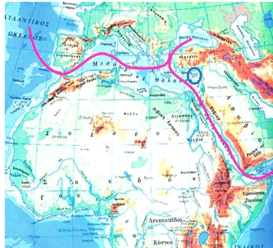
Εικόνα 1 : Γεωγραφική – Στρατηγική Θέση Κύπρου