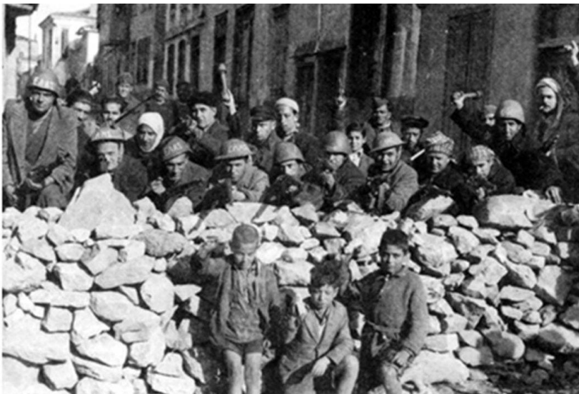
Οι «ήρωες» μαχητές του ΕΛΑΣ τοποθετούν μπροστά στα οδοφράγματα παιδάκια ώστε να αποτρέψουν τις εθνικές δυνάμεις από το να πυροβολήσουν

Στις 3 Δεκεμβρίου του 1944 αρχίζουν τα Δεκεμβριανά. Ο όρος, είναι μία εξωραϊσμένη απόδοση της κομμουνιστικής εγκληματικής ανταρσίας για την βίαιη αρπαγή της εξουσίας, λίγο μετά την αποχώρηση των γερμανοϊταλικών στρατευμάτων κατοχής.