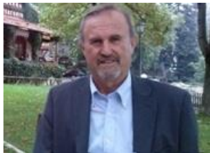
Του Ιωάννη Αθ. Μπαλτζώη*

Την 27 η Νοεμβρίου, οι Τζιχαντιστικές δυνάμεις, με επικεφαλής την οργάνωση Χαγιάτ Ταχρί αλ Σιάμ (HTS), πρώην Τζαμπχάτ Νούσρα, πρώην Ισλαμικό Κράτος εξαπέλυσε την επιχείρηση «Repelling the Aggression, όπου με ξαφνική επίθεση από την επαρχία Ιντλίμπ στην πόλη-κόσμημα της Συρίας, το Χαλέπι και το κατέλαβαν σχεδόν όλο. Κατόπιν με την δυναμική του αιφνιδιασμού, της σφοδρότητας και της αποχώρησης χωρίς αντίστασης του Συριακού Εθνικού Στρατού, προχώρησαν προς τον Νότο, ελέγχοντας τον υψίστης σημασίας αυτοκινητόδρομο M5 που συνδέει την Δαμασκό με τον Βορρά και τα σύνορα με την Τουρκία. Οι τζιχαντιστές εξόρμησαν από την περιοχή του Ιντλίμπ, μια περιοχή δυτικά της Συρίας, που μετά την Συμφωνία της Αστάνας τον Σεπτέμβριο 2017, μεταξύ Ρωσίας, Ιράν και Τουρκίας, κατέληξαν σε συμφωνία στο θέμα του Ιντλίμπ και οριοθέτησαν την τέταρτη ζώνη μη διαμάχης, την περιφέρεια του Ιντλίμπ. Εκεί συγκέντρωσαν τις ηττημένες τζιχαντιστικές τρομοκρατικές ισλαμιστικές οργανώσεις, μαζί με τις οικογένειές των, με αποτέλεσμα να σχηματιστεί μια τζιχαντιστική «χωματερή», με ευθύνη, επίβλεψη, τροφοδοσία από την Τουρκία.