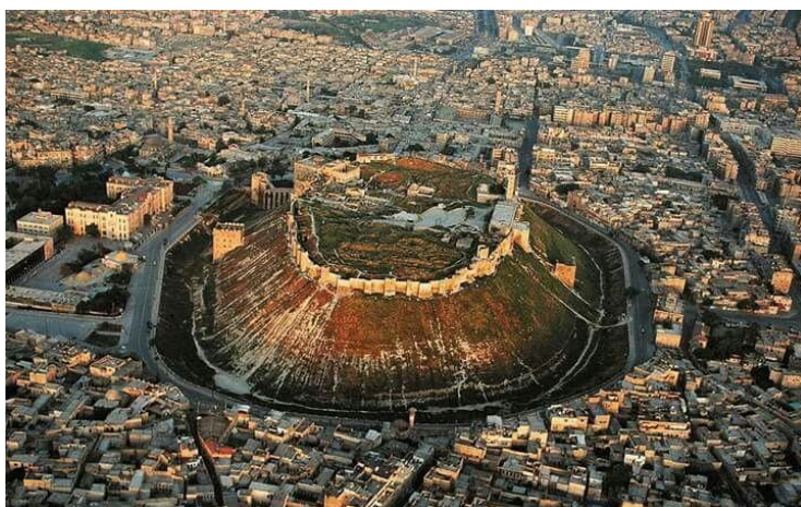
Το κάστρο της Βεροίας/Χαλεπίου.

Η επίθεση αυτή είναι το ηχηρό μήνυμα της Τουρκίας προς τον Άσαντ για διαπραγματεύσεις και από θέση ισχύος να του επιβάλει την κατοχύρωση των εδαφών που κατείχε. Τώρα θέλει και την περιοχή του Χαλεπίου, αφενός να συνενώσει τις περιοχές Ιντλίμπ, Αφρίν και Γιαραμπλούς σε ενιαίο χώρο και αφετέρου να εγκαταστήσει τους Σύριους πρόσφυγες που έχουν συσσωρευτεί στην Τουρκία.