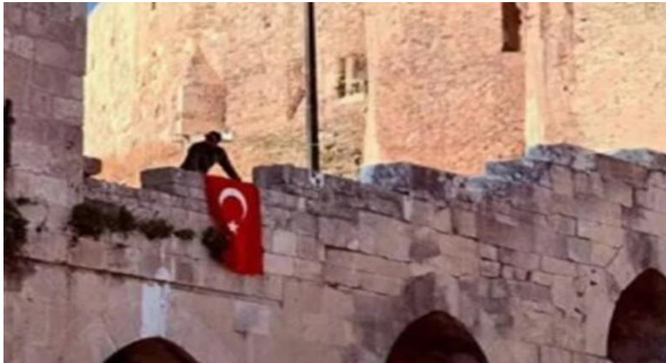
Τζιχαντιστές αναρτούν την τουρκική σημαία στο κάστρο του Χαλεπίου.