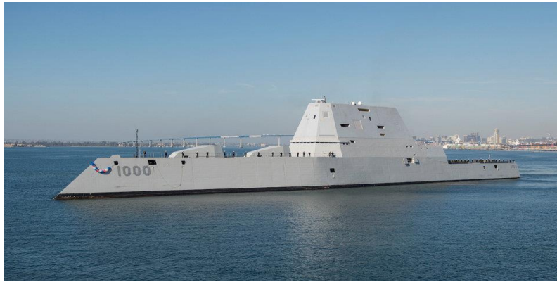
Το αμερικανικό Stealth αντιτορπιλικά της κλάσης Zumwalt.

τοποθέτησης τεσσάρων συλών κάθετης εκτόξευσης πυραύλων, στο καθένα, με δυνατότητα φιλοξενίας τριών πυραύλων, η ταχύτητα των οποίων φτάνει τα 5 Mach, δηλαδή πέντε φορές την ταχύτητα του ήχου. Η δυνατότητα του συστήματος που διαθέτει αυτή τη στιγμή στα αντιτορπιλικά αυτής της κλάσης, είναι να εκτοξεύουν βαλλιστικούς πύραυλους, ο οποίοι στη συνέχεια θα απελευθερώνουν ένα όχημα ολίσθησης το οποίο θα φτάνει και θα ξεπερνά τα 8 Mach!!! Πράγμα που θα καθιστά την αναχαίτηση του εντελώς αδύνατη με τα σημερινά αντιβαλλιστικά δεδομένα.